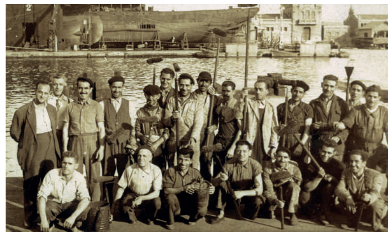
▲ Primeiros rolos fabricados com uma espécie de rolo de lã para pintores de barcos no porto de Barcelona. São as primeiras imagens que guardamos da empresa do ano de 1953.

A nossa origem é graças ao meu avô, que, juntamente com a minha avó, num local muito pequeno do bairro do Poble Sec (Barcelona) se dedicou a fazer manualmente uma espécie de rolo de lã para pintores de barcos do porto de Barcelona. São as primeiras imagens que guardamos da empresa do ano de 1953. Por isso, começámos a contar dessa altura.