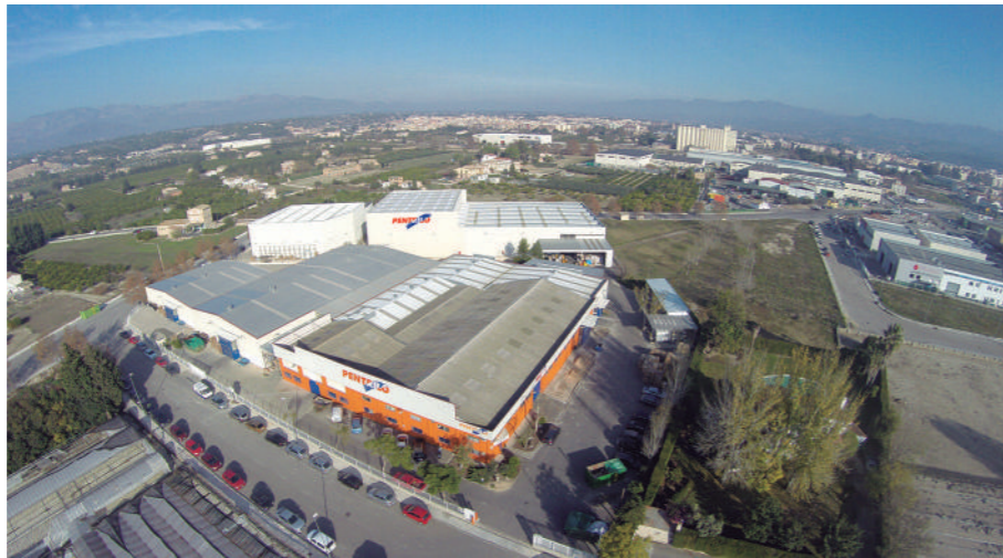
▲ Centro de Logística e Produção de Tortosa (Tarragona)