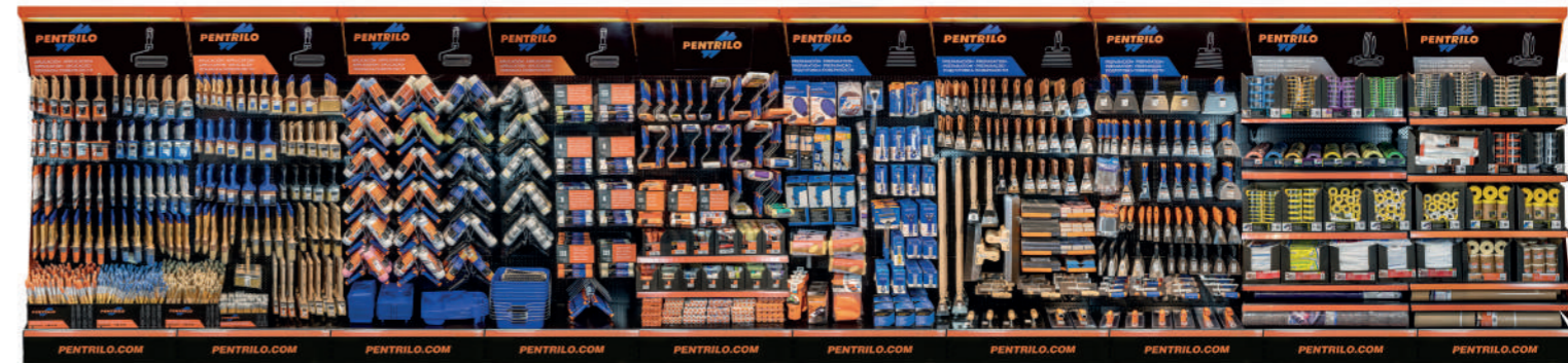
▲ Expositor de produtos da Pentrilo

Para fazer uma ideia, a média da idade da nossa equipa diretiva são 45 anos e quase todos estamos há